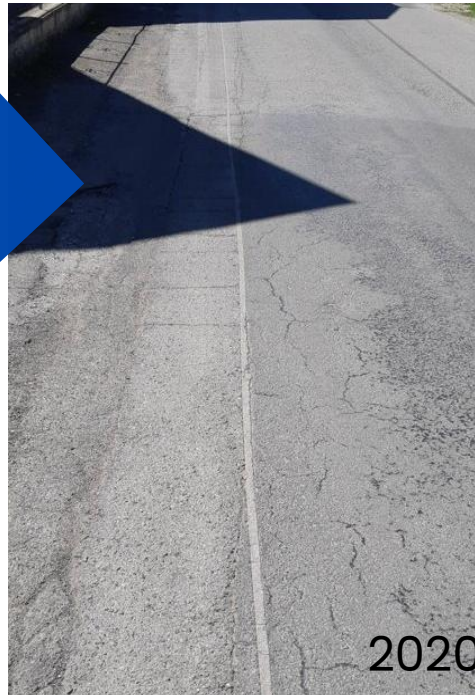
Scavo in microtrinnea e riempimento flowmix fast