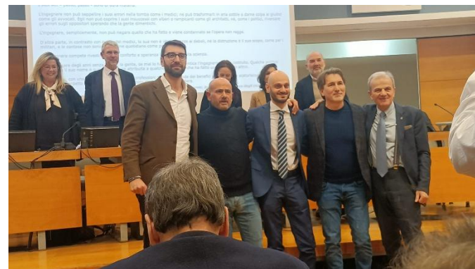
Evento Tematiché - 10.02.2025